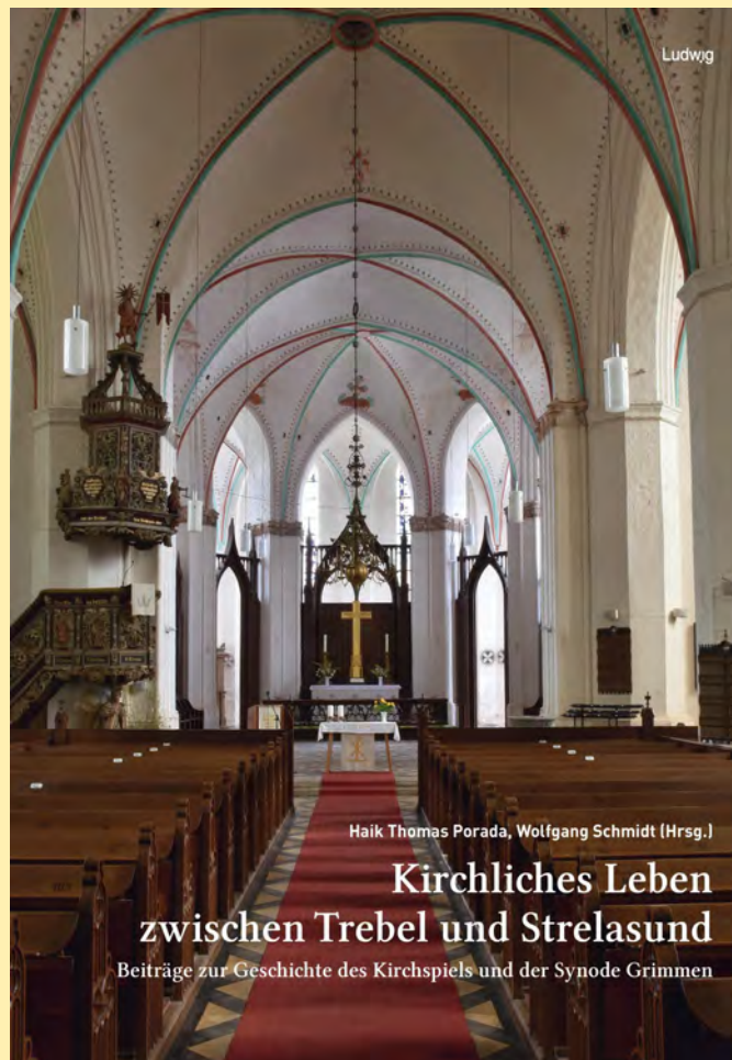
Haik Thomas Porada, Wolfgang Schmidt (Hrsg.)