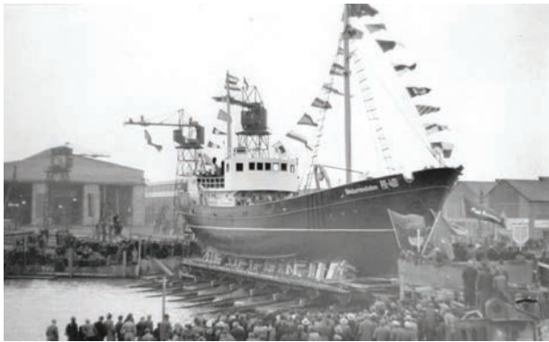
Stapellauf des ersten Loggers von der »Volkswerft«, 1949

Am 15. Juni 2023 jährt sich die Namensverleihung »Volkswerft« an den damals im Entstehen begriffenen Schiffbaubetrieb in Stralsund zum 75. Mal. Als größter Betrieb prägte die Werft das Leben in der Stadt bis in die jüngste Vergangenheit. Tausende Menschen fanden dort Arbeit, ganze Stadtteile wurden deshalb neu gebaut und die 1996 fertiggestellte Schiffbauhalle ist unübersehbarer Teil des Stadtbildes.