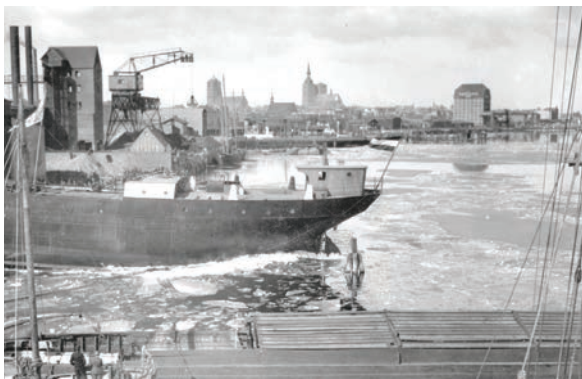
Staatswerft, ca. 1935