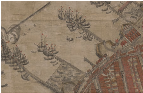
Auszug Stauedeplan, Hafen 1647