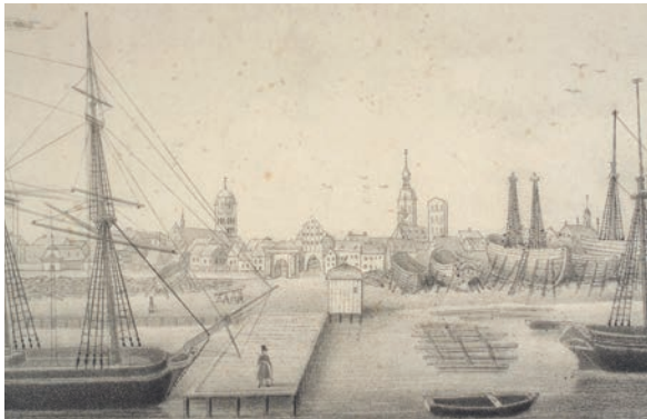
Stralsunder Werftgelände, 1842